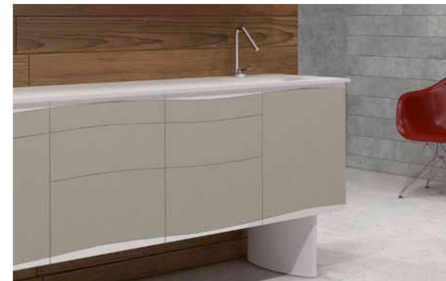
Sistema push & pull.