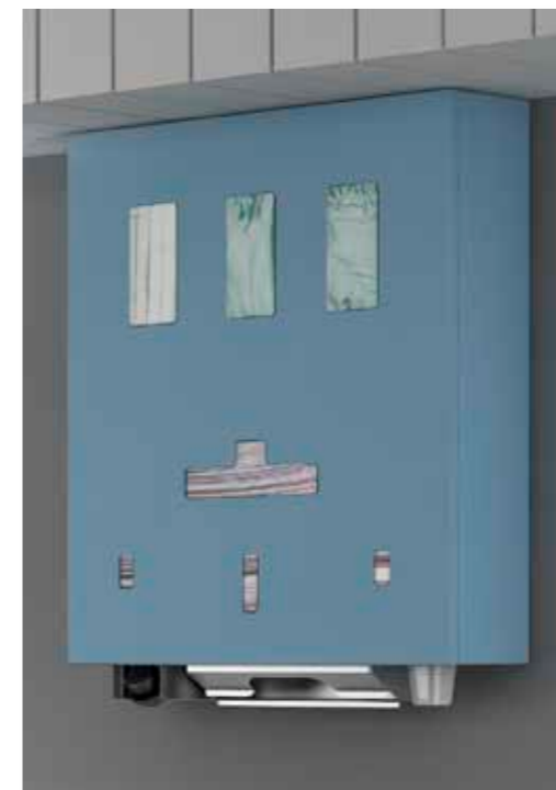
Distributore MELODY per prodotti monouso.

EN_ Drawer cabinet on wheels, Corian top with built-in handle. FR_ Meuble sur roulettes, plateau en Corian avec poignée intégrée. DE_ Rollwagen, Corian-Top mit integriertem Griff.