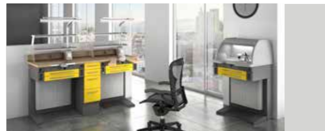
EVOLAB P. 38/39