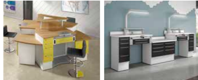
EVOLAB P. 42/43 EVOLAB P. 44/45