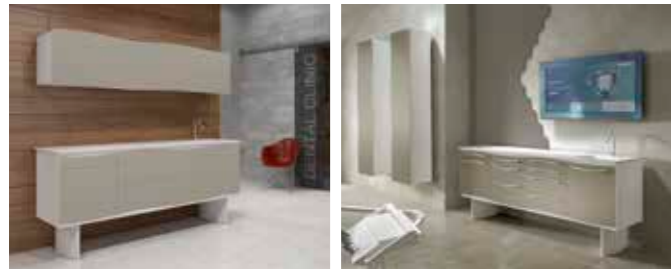
PULSAR push & pull P. 16-17 PULSAR P. 20-21