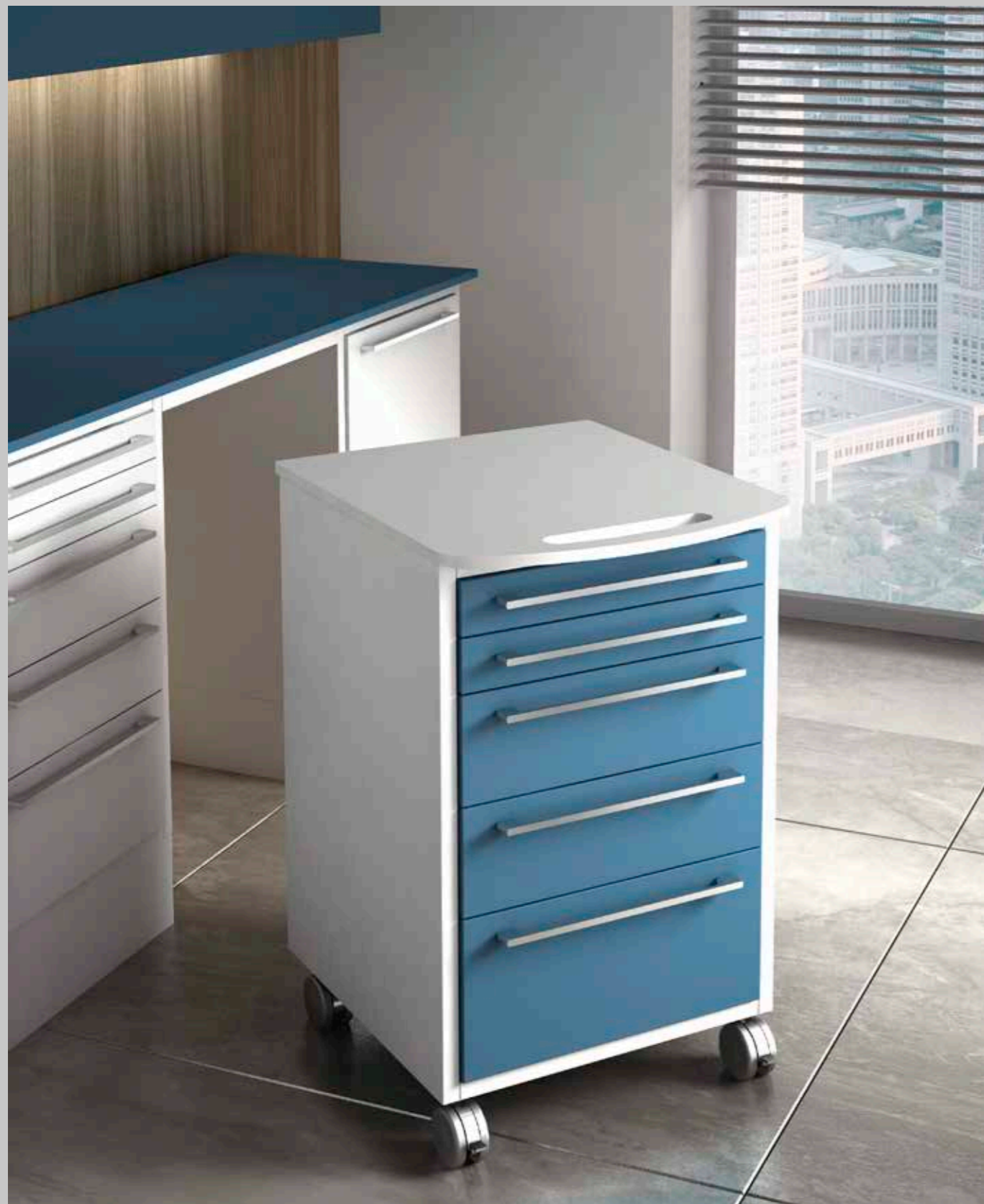
Servomobile, top in Corian con maniglia incorporata.

EN_ Drawer cabinet on wheels, Corian top with built-in handle. FR_ Meuble sur roulettes, plateau en Corian avec poignée intégrée. DE_ Rollwagen, Corian-Top mit integriertem Griff.