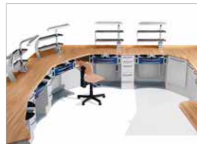
EVOLAB P. 46/47