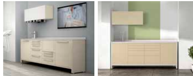
SKYLINE P. 10/11 SKYLINE push & pull P. 14/15