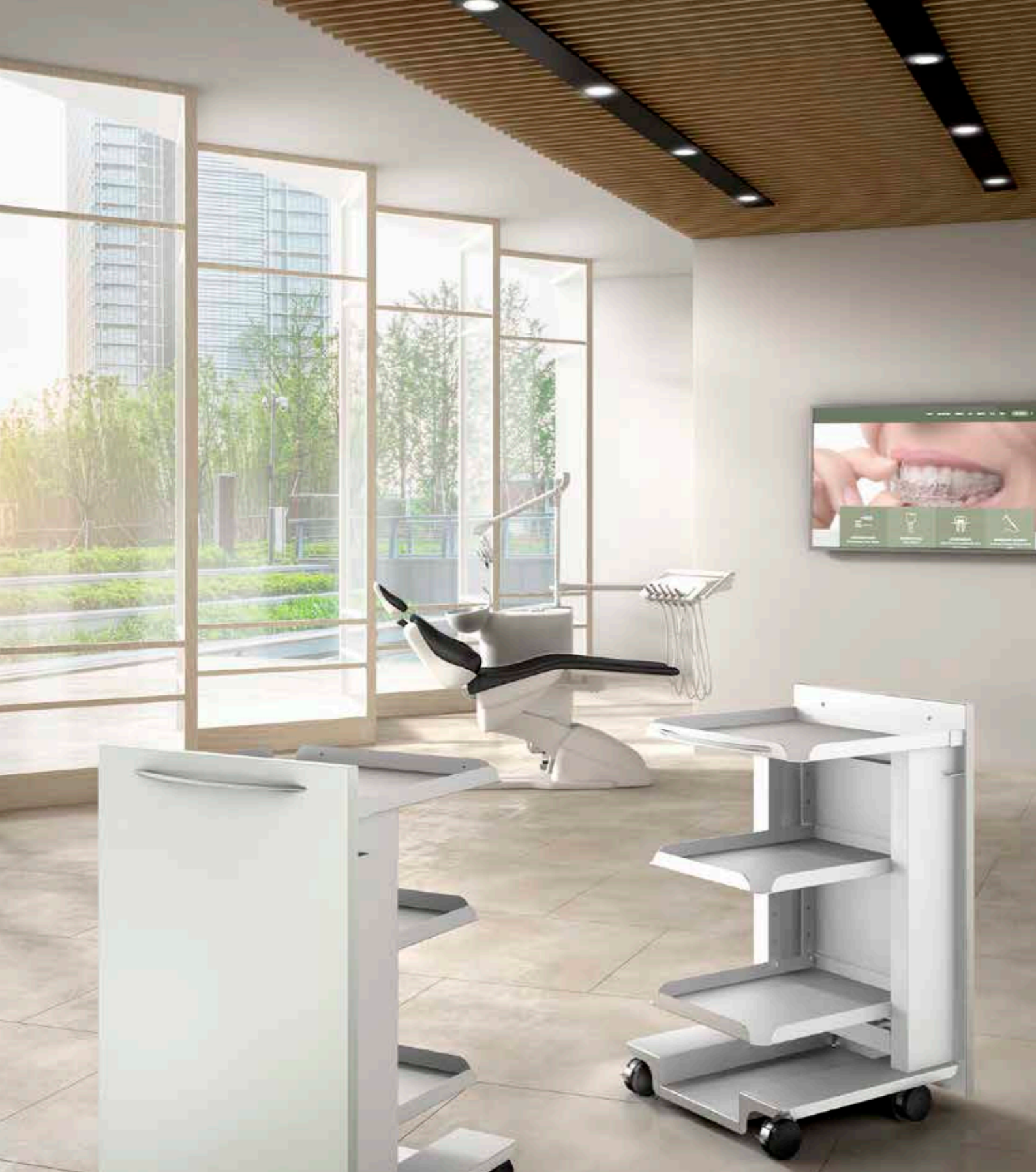
Carrello elettrificato con ripiani: versatile e maneggevole.

EN_ Trolley with sockets and shelves: versatile and easy to handle.