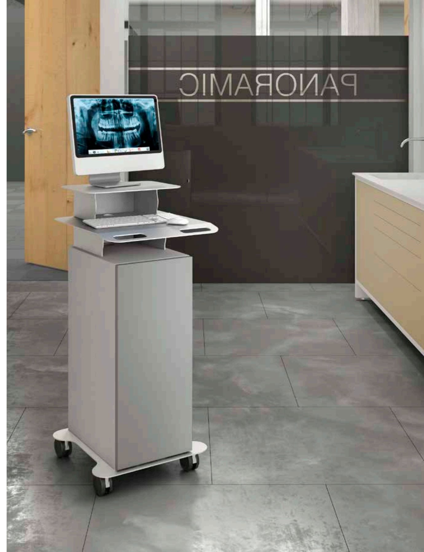
Carrello porta-scanner: funzionale e pratico, ideale ogni giorno.

DE_ Rollwagen mit Regalen: einfach und praktisch.