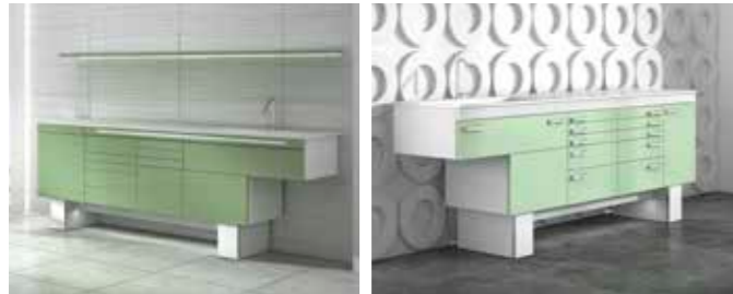
ALNAIR push & pull P. 4/5 ALNAIR P. 8/9