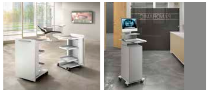
COMPLEMENTS P. 28 P. 29