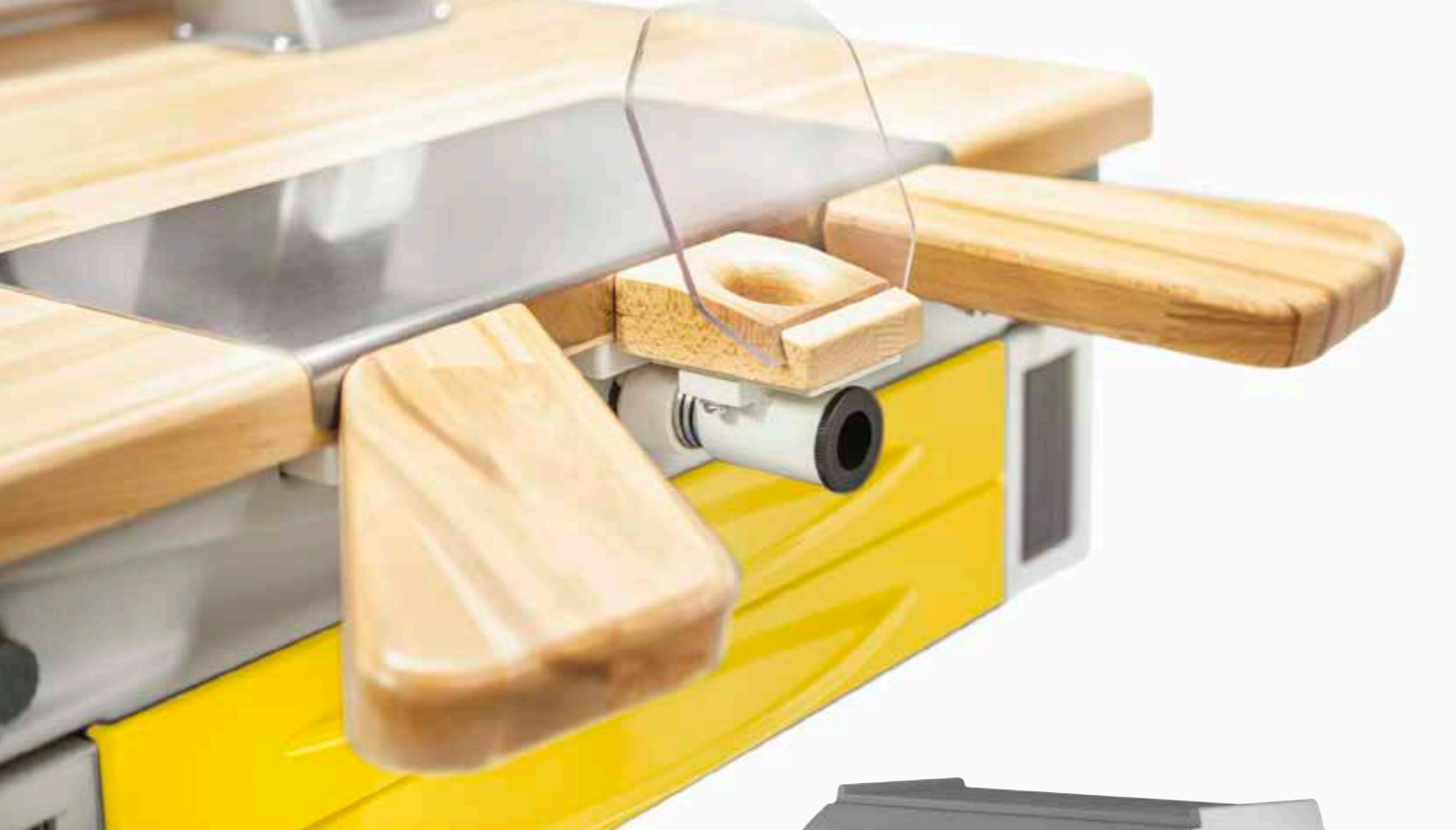
Top e poggia braccia in faggio naturale.

EN_ Worktop and armrests in natural beech. FR_ Plateau et appui-bras en hêtre naturel. DE_ Arbeitsplatte und Armlehne in Naturbuche.