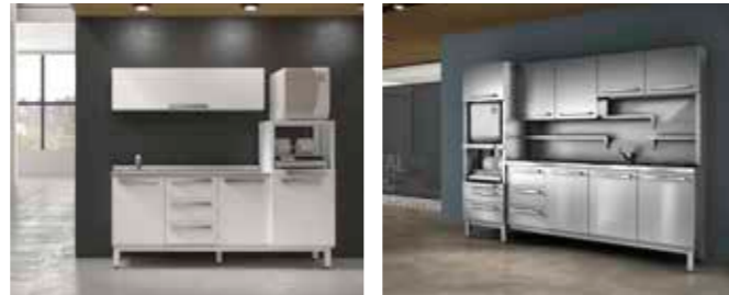
KAMAL PK P. 30/31 KAMAL steril inox P. 32/33