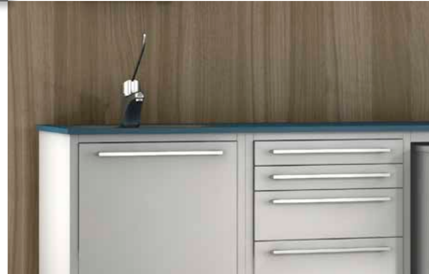
Top in vetro con vasca integrata.

EN_ Wall-mounted unit MELODY for consumables. FR_ Distributeur MELODY pour les produits jetables. DE_ Hygieneschrank MELODY für Einwegartikel.