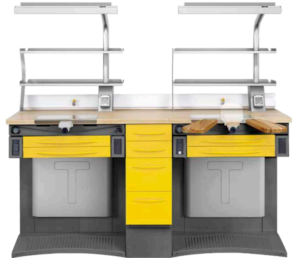
Caviglia aspirante in ABS.

EN_ EVOBOX including suction and lighting systems. FR_ EVOBOX avec aspiration et système d'éclairage. DE_ EVOBOX komplett mit Absaugeinheit und Beleuchtung.