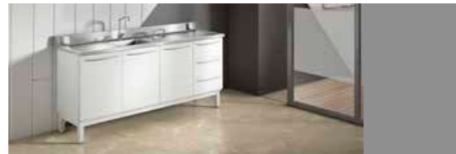
EVOLAB P. 36/37