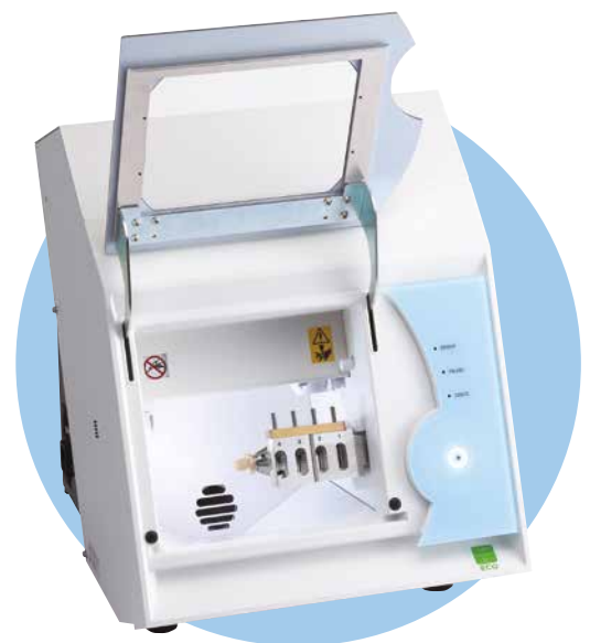
DWX-4 met ZAT-4D

De DWX-4 is uitgerust met een blazer die verhindert dat er zich te veel stof ophoopt. De negatieve-iongenerator neutraliseert dan weer de statische elektriciteit tijdens het frezen van PMMA. Voor extra gemoedsrust heeft de DWX-4 ook een stofverzamelsysteem en een sensor die de zorgt dat de machine enkel start als de afzuiging is ingeschakeld.