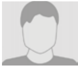
Ajanovic Midhat 06.01.03