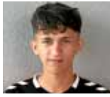
Atlas Mert 06.01.03